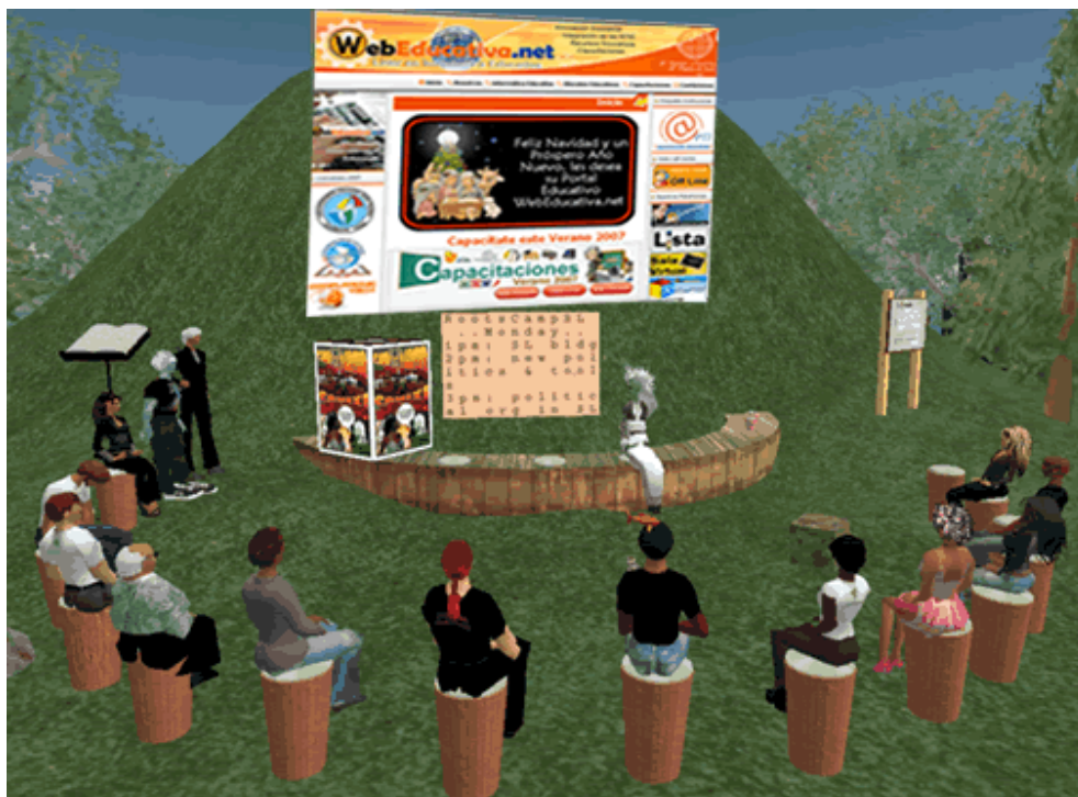
Figura 3: Vista de una clase en Second Life