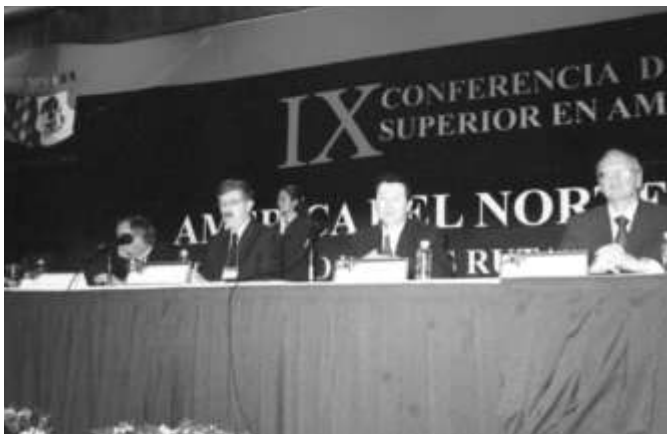
El Gobernador de Guanajuato, Juan Romero Hicks, propuso dar al TLC un contenido humanista

La agenda de este encuentro refleja el potencial y la trascendencia del esfuerzo de CONAHEC y de las instituciones que creen que la educación superior es una tarea para construir el futuro. Las conferencias magistrales que se impartieron fueron: "América del Norte y su potencial: Trazando nuevas rutas con la educación superior"; "Tendencias de futuro: Carreras y Competencias para la sociedad del Conocimiento"; "La Segunda Década de América del Norte: Hacia una agenda de convergencia para la educación